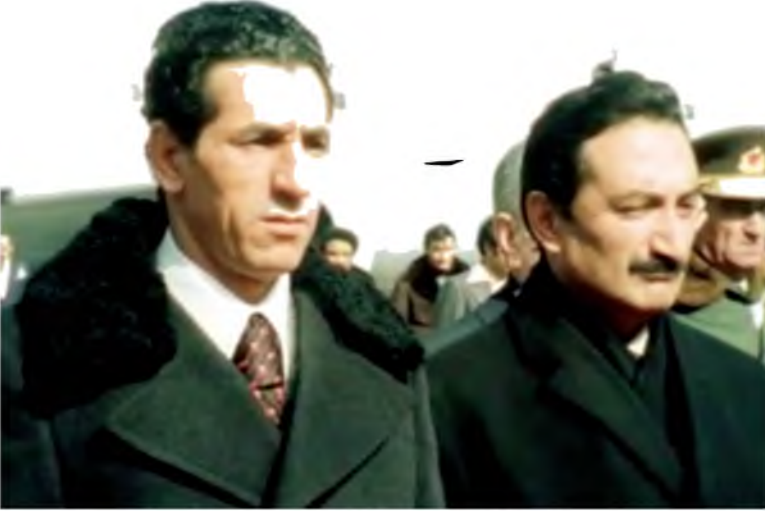
استقبال الرئيس التركي بولنت أجاويد لرئيس الوزراء الليبي عبد السلام جلود في أنقرة، تركيا، 22 / 2 / 1978.